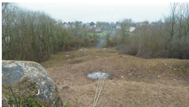
Photo réalisée depuis le PDT en direction de la mer.

Dans le numéro 36 de novembre 2006, nous avons évoqué l'existence d'une villa dans le terrain situé sous le PDT dont le célèbre propriétaire, Santos Dumont, appréciait l'observation du ciel et de la mer depuis le toit terrasse. Malheureusement, cette construction étant située dans le champ de vision des observateurs, elle sera détruite par l'armée allemande.