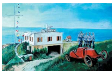
Tableau de la villa de Santos Dumont

nous retrouvons la configuration de la propriété à l'époque de l'avionneur.